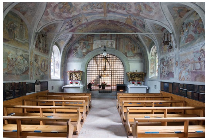
Die reich ausgeschmückte Kapelle im Riedertal

Die meisten Häuser und Vorplätze waren liebevoll mit Kreuzen, frischen Blumen, Hausaltären, Heiligenstatuen, Teppichen und Fahnen geschmückt. Doch in den letzten Jahren ist nicht nur die Zahl der an diesem Brauch teilnehmenden Gläubigen kleiner geworden. Verkürzt wurden auch die Routen der Prozessionen, und beinahe gänzlich verschwunden ist der einst oft in nächtelanger Fronarbeit errichtete Schmuck an den Häusern und auf den Plätzen.