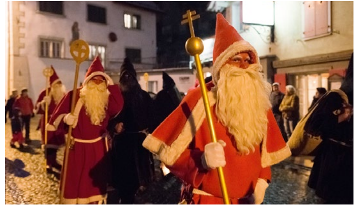
Einzug des Samichlaus in Flüelen

Warum auch immer, aber Blau ist keine liturgische Farbe. Aus diesem Grund hatte sich der Urner Kunstmaler Heinrich Daniöth (S. 98) 1929 entschieden, den Altdorfer Samichlaus mit einem blauen Messgewand auszustatten. Er wollte so einen möglichen Konflikt mit dem Bischof von Chur vermeiden, zu dessen Diözese Uri gehört.