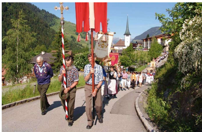
Fronleichnamsprozession in Spiringen

Nach wie vor in den meisten Urner Dörfern gepflegt wird die Prozession an Fronleichnam, der in Uri ein kirchlicher Feiertag ist. Sie wird jedoch infolge der durch das Zweite Vatikanische Konzil beschlossenen Liturgiereform in weit-aus bescheidenerem Rahmen durchgeführt, als dies bis in die frühen 1960-er Jahre der Fall war. Der Brauch, das Allerheiligste in einer wertvollen Monstranz unter einem Baldachin, dem sogenannten Himmel, durch die Dörfer zu tragen, geht auf das 13. Jahrhundert zurück. An der Prozession nahmen stets die politischen Honoratioren teil. Ihnen schlossen sich die Erstkommunikanten, Schulkinder und Mitglieder religiöser Vereine und Bruderschaften an. Zusammen mit der Dorfmusik und den Gläubigen der Pfarrei zogen sie durch die Gassen, um an einem eigens für die Prozession errichteten Altar die Heilige Messe zu feiern.