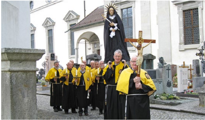
Die Barmherzigen Brüder an der Karfreitagsprozession

Jakob-Kapelle (untere Heilig-Kreuz-Kapelle) in Altdorf vorgeschrieben. Bis heute gehören der Gesellschaft ausschliesslich Männer an. Seit einigen Jahren treffen sie sich am letzten Samstag im November zum Bruderschaftstag – mit einem kirchlichen und weltlichen Teil.