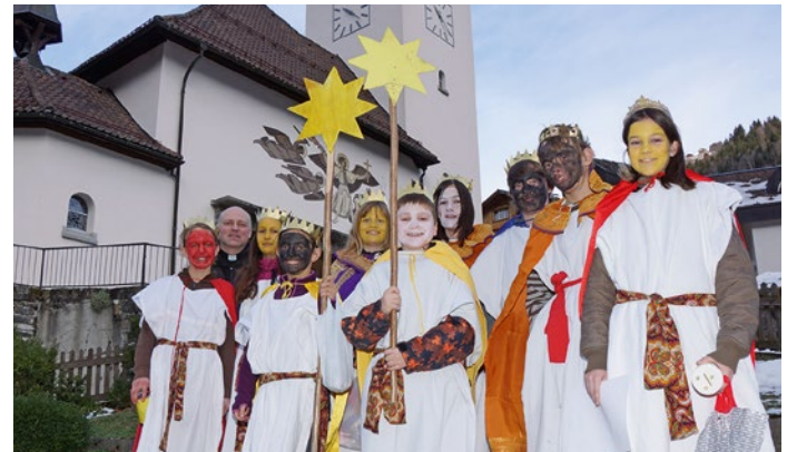
Mehr als drei Könige – die Sternsinger von Spiringen

zung für «Christus mansionem benedicat» (Christus segne dieses Haus). Der Volksmund deutet sie aber seit jeher als die Initialen der Drei Könige Caspar, Melchior und Balthasar. So wie in der übrigen Schweiz wird auch in Uri das Sternsingen vom päpstlichen Missionswerk «missio» in enger Zusammenarbeit mit Helferinnen und Helfern der jeweiligen Pfarrgemeinden durchgeführt.