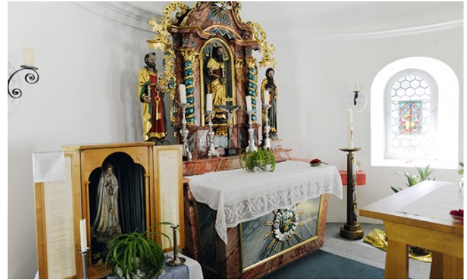
Kapelle St. Matthias in Abfrutt, Göschenen

den Alltags- und Festkalender der Urnerinnen und Urner. Je mehr aber in den letzten Jahrzehnten die bestimmende Rolle der Kirche kleiner geworden ist, desto mehr ging auch das über Generationen gepflegte religiöse Brauchtum verloren. Doch einige haben sich, wenn auch vielfach in bescheidener und veränderter Form, bis heute halten können. Im Folgenden werden jene religiösen Bräuche näher vorgestellt, die heute noch von der Allgemeinheit gepflegt werden und für Uri typisch sind.