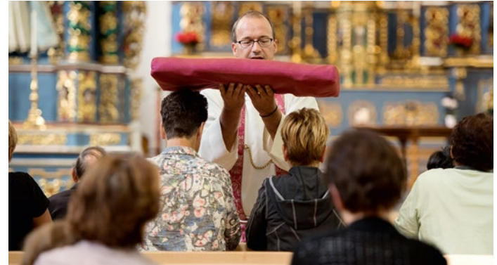
Der Messacher-Segen in der Pfarrkirche Schattdorf

oder ein volkstümlich gemaltes Bild von einem überstandenen Unfall. Zwar ist der Brauch der Votivgaben in den letzten Jahrzehnten stark zurückgegangen. Doch wer sich die Zeit nimmt, die verschiedenen Votivtafeln näher zu betrachten, wird nicht nur einen interessanten Einblick in die Sorgen und Nöte und das einstige Alltagsleben der vornehmeren und einfachen Urnerinnen und Urner erhalten. Die Daten auf den Votivgaben zeigen, dass noch heute mit einer Tafel für eine gewährte Bitte gedankt wird.