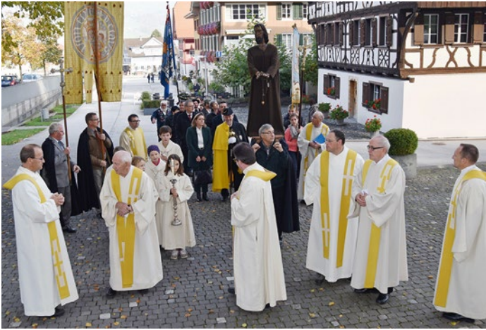
Urner Landeswallfahrt nach Sachseln