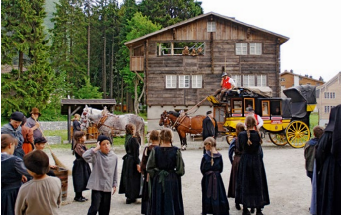
Freilichtspiele «D'Gotthardposcht» in Andermatt