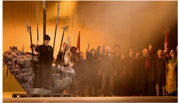
Altdorfer Tellspiele 2016

Oper, Drama, Stummfilm, Hörspiel oder als Musical, die Geschichte des Schweizer Freiheitskämpfers (S. 12) vermag auch heute noch ein grosses Publikum zu begeistern. Die bekannteste aller Fassungen und Formen ist jedoch das Drama «Wilhelm Tell» von Friedrich Schiller. Es ist das letzte fertiggestellte Bühnenstück des deutschen Dichters und Historikers. Die Idee dazu lieferte ihm sein Freund Johann Wolfgang von Goethe. Und obwohl Schiller selber die Schweiz nie besucht hatte, treffen die Beschreibungen und Ortsangaben in seinem Stück bemerkenswert genau zu. 1804 fand die Uraufführung des Telldramas unter Goethes Regie im Hoftheater in Weimar statt. Das Stück wurde begeistert aufgenommen. Noch im selben Jahr wurde das Schauspiel in Luzern von einer deutschen Wandertruppe aufgeführt. Hier hielt sich die Begeisterung jedoch in Grenzen. Auch auf den Berufstheater-Bühnen in Zürich vermochte das Spiel nicht zu überzeugen. Das Drama gehörte in der Schweiz eindeutig auf die Volksbühne: Mit Aufführungen unter anderem in Gisikon, Huttwil, Stäfa, Zweisimmen, Belp und Altstetten entwickelte sich das Theaterspiel schliesslich nach der Gründung des Bundesstaates zu einem eigentlichen Hit.